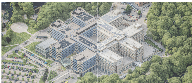
Renovatie van de gevels: vóór en na

Het Citadelle-ziekenhuis (900 bedden, 130 417 m 2 verwarmde oppervlakte, 36 GWh/jaar gas en 10 GWh/jaar elektriciteit), een iconisch gebouw dat het landschap van Luik domineert, wordt momenteel grondig gerenoveerd. Dit grootschalige project heeft tot doel de energievoorziening van de instelling te versterken en tegelijkertijd de continuïteit van de ziekenhuisactiviteiten te waarborgen.