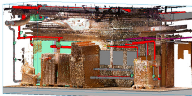
Vestiging van de nieuwe warmwaterinstallatie in de puntenwolk

Op basis van lasermetingen die met een drone zijn uitgevoerd en vervolgens zijn omgezet in puntenwolken, is een 3D-BIM-model gemaakt van de gevels, de leidingkanalen, de technische ruimtes en de bestaande structurelementen. Momenteel is de vergunning verleend, zijn de meeste bestekken aanbesteed en staat de bouw op het punt van start te gaan.