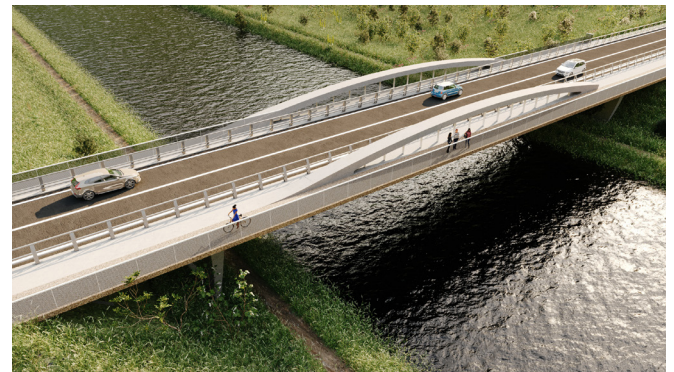
Bouwwerk boven het kanaal

Verschillende stormbekkens worden ingericht, alsook een overstromingsgebied bij de samenloop van de beken van Vraimont en Sint-Jan, ter voorkoming van overstromingsrisico's.